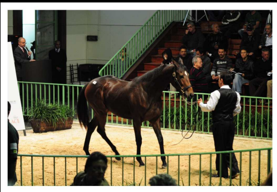
Star Magic 1ª ganhadora da geração 2009

• Inscrições até 15 de Fevereiro de 2012.